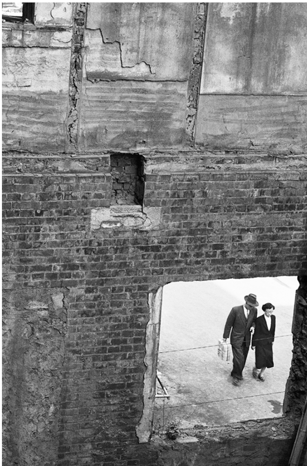
Han Youngsoo, Myeongdong, Seoul, Korea 1956 1956 (printed in 2024) Toned gelatin silver print, image size, 90 x 60 cm

2024年8月24日(土) - 9月21日(土) オープニングレセプション: 2024年8月24日(土) 17:00-19:00 開廊時間: 火-土(日月祝休) 12:00-19:00