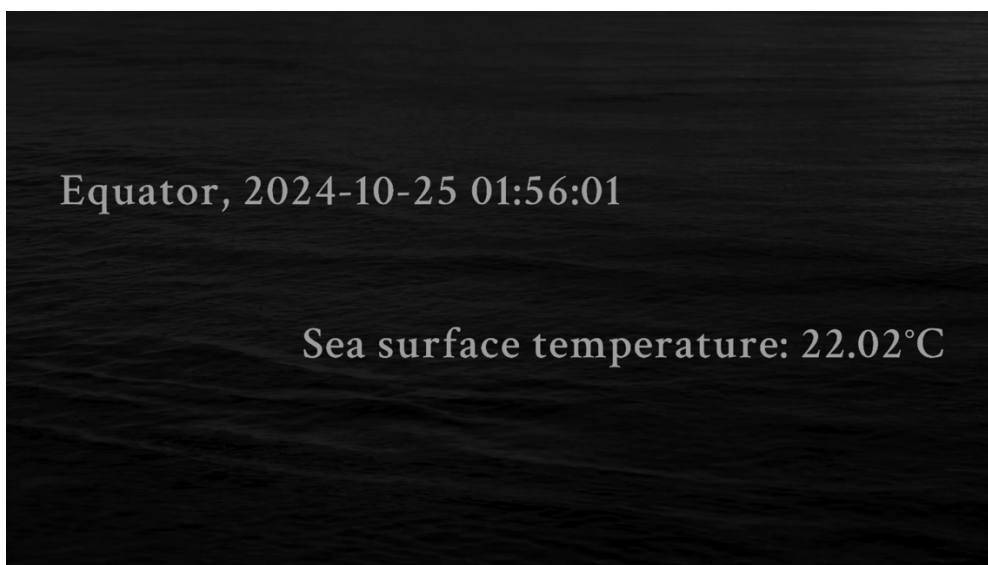
Glas, 2024, video 8 min

もう一方の壁に設置されたモニターには黒い海の映像が流れ、画面には世界の海のリアルタイムの海面温度などの情報が表示されます。ビデオ作品「Glas」のその黒い画面は、海水温の上昇で珊瑚が白化し死に至る現象を冷静に映し出し、すべての生命の根源である海が危機的状況にあることを、静かに警告しています。