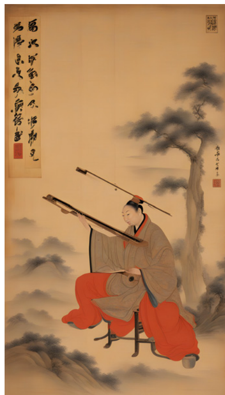
Adachi Tomomi, AI-generated image of Spirisapientlyra , 2024